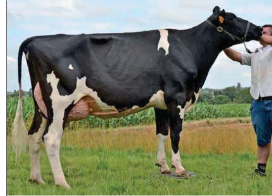
Himalaya (v. Duplex), kampioene vaarzen Productie: 2.03 257 8157 2,46 3,32 l.l.