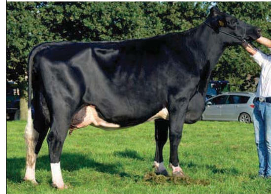
Helaasheid van de Koutherhoeve (v. Damian), kampioene midden Productie: 2.00 423 9476 4,03 3,57