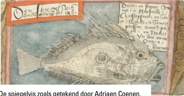
De spiegelvis zoals getekend door Adriaen Coenen.

uitgedroogde karkassen met vel aan de kamerlamp te hangen. In zijn boek worden in de proloog eerst de meest exotische wezens beschreven, dus ook de mens. Een van de bijzondere mensensoorten die hij beschrijft is de tegenvoeter. Dat is in zijn geval niet iemand die aan de andere kant van de wereld leeft, maar iemand die een van zijn extreem grote voeten boven zijn hoofd houdt ter bescherming tegen de zon.