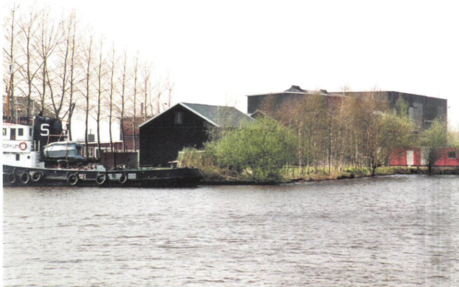
Het Oude Winschoterdiep.

De eerste fase van het masterplan bestaat uit het ophogen van de boezemkaden in het gebied Eemskanaal-Dollard, de Oldambt- en de Duurswoldboezem. De Eemskanaal-Dol-