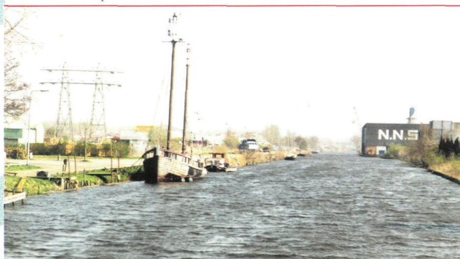
Het Oude Winschoterdiep.

• In verband met Aquatech bevat nummer 19 van 24 september een speciale beurspecial. Deze uitgave wordt voorafgegaan door een voorbeschouwing in nummer 18 van 10 september en gevolgd door een nabeschouwing in nummer 20 van 8 oktober.