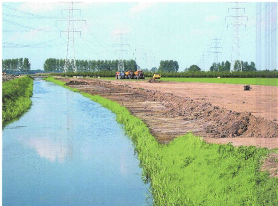
Aanleg van een retentiegebied.

Indien het noodzakelijk is voor het gewenste gebruik van het waterbergingsgebied inrichtingsmaatregelen te treffen, wordt een besluit tot het aanleggen van een waterstaatswerk genomen. Zodra het besluit tot het aanleggen van een waterstaatswerk onherroepelijk is geworden, heeft het waterschap een titel om de inrichtingsmaatregelen uit te voeren. Dit wil echter nog niet zeggen dat het waterschap ook direct aan de slag kan. In de meeste gevallen heeft het waterschap over de percelen waarop de werkzaamheden plaatsvinden, geen zeggenschap en is het dus noodzakelijk om een nadere regeling te treffen met de eigenaren. Het waterschap heeft hierbij de volgende mogelijkheden: aankoop van het desbetreffende perceel, vestigen van een zake-