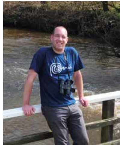
Albert Vliegthart De Vlinderstichting