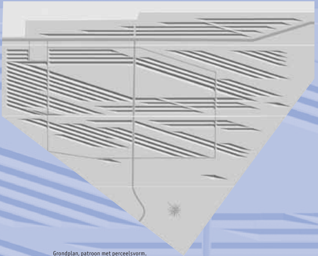
Grondplan, patroon met perceelsvorm.