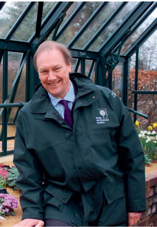
aankoop van nieuwe tuinplanten'

de tulp, hyacint en veel bijzondere bolgewassen, is de RHS dit voor lelie en narcis. KAVB en RHS onderhouden voor deze gewassen contact met elkaar. "Bolgewassen zijn nu eenmaal erg belangrijk voor de RHS. Ze vormen een wezenlijk onderdeel van de plantenwereld. Zonder bolgewassen zou de plantenwereld er een stuk saaier uitzien."