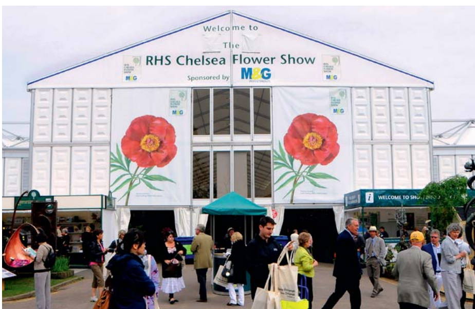
De jaarlijkse Chelsea Flower Show is een van de belangrijkste activiteiten van de RHS

Voor de bloembollenwereld is de RHS geen onbekende organisatie. Op het gebied van de naamgeving van nieuwe cultivars is de RHS een van de zusterorganisaties van de KAVB. Waar de KAVB internationale registratieautoriteit is voor