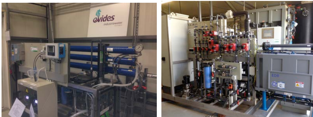
Afbeelding 3. Pilotopstelling nanofiltratie (links) en electrodialysis reversal (rechts)

In verband met variaties in voedingwatersamenstelling moeten enigszins conservatieve waarden worden aangehouden voor de te behalen recoveries. Voor spui- en bioxwater zijn recoveries van 75% reëel, voor koeltorenspuiwater 58%.