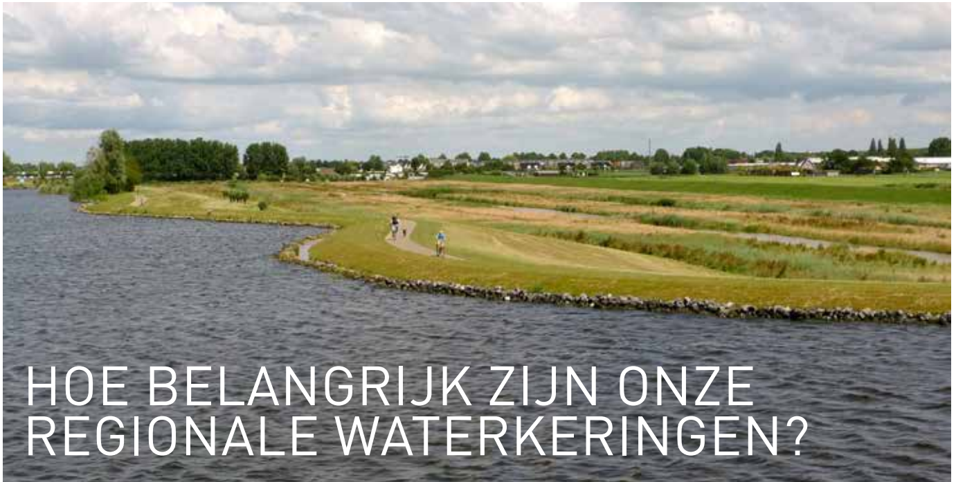
Polder Oudendijk, met op de achtergrond Woubrugge. De kade langs de zuidwestelijke oever van het Braassemermeer is in 2011 versterkt

Sinds 2014 gelden nieuwe normen voor waterkeringen langs de kust en de grote rivieren. Nieuw is dat gekken wordt naar de kans op een overstroming en de gevolgen ervan (inclusief slachtoffers). Voor regionale dijken en wateren gelden nog de oude normen. Hoe gevaarlijk zijn binnenwateren eigenlijk? Zijn regionale dijken nog wel zo belangrijk? Het hoogheemraadschap van Rijnland paste de nieuwe, landelijke normen toe op een lokale situatie, de polders rond het Braassemermeer.