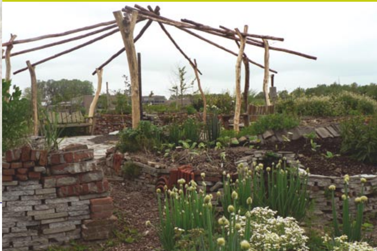
De proeftuin van Caetshage.

De stadsboerderij Caetshage ligt op loopafstand van de ecologische wijk Eva-Lanxmeer. De boerderij ligt hier dus weliswaar niet midden in de nieuwe wijk, maar biedt voor de burgers wel op loop- of fietsafstand een plek voor recreatie, educatie of aankoop van verse (boerderij)producten.