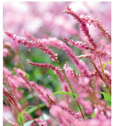
Persicaria Pink Elephant