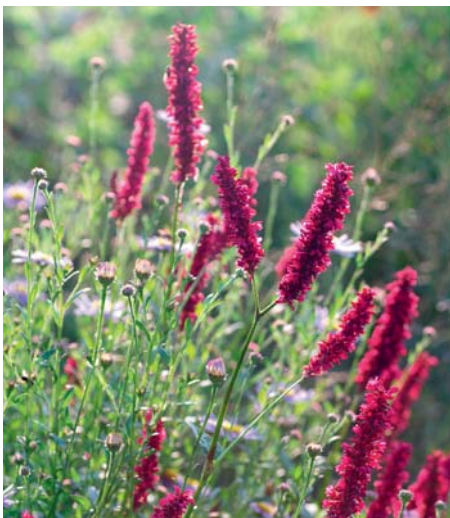
Persicaria Fat Domino