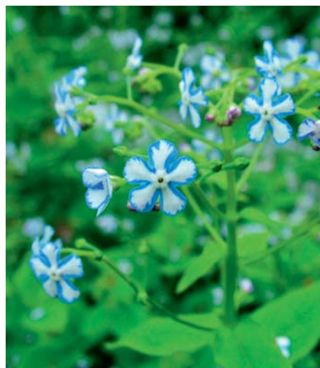
Brunnera Starry Eyes

rechtelijk beschermde aanwinst met in het voorjaar bizar gekleurde bladeren die een mooi contrast opleveren met de blauwe bloemen. Is op zijn mooist in de lente met blad dat in de zomer naar groen kleurt. Chris Ghyselen: "Voor de komende jaren zitten er nog een aantal nieuwe ontwikkelingen in de pijplijn, want we blijven zoeken naar nieuwe verbeteringen. Daarnaast beschikken we nog over twee eigen Helianthus -selecties, te weten Helianthus Carine , een iets lagere vorm van Lemon Queen met donkere stelen en licht crème bloemen en Heli-