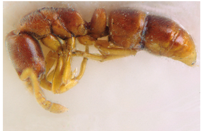
2. De bruine staafmier Ponera testacea van Huizen, Noord-Holland. 2. Ponera testacea from Huizen, Noord-Holland.