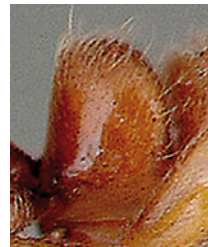
4. De petiolus van Ponera testacea . 4. Petiolus of Ponera testacea .

2006). In Frankrijk is P. testacea voor zover bekend alleen waargenomen in het Mediterrane gebied, ruwweg ten zuiden van de lijn Toulouse-St. Etienne-Grenoble en op Corsica (AntArea 2010). Ten oosten ligt de dichtstbijzijnde vindplaats in de Duitse deelstaat Brandenburg, bij Berlin, en meer zuidoostelijk in Rheinland-Pfalz en Saarland. Hier heeft P. testacea zijn noordgrens tot 52° N (Seifert 2007). In Groot-Brittannië zijn enkele exemplaren gevonden in potvallen langs de oostkust van Kent (Attewell et al. 2010).