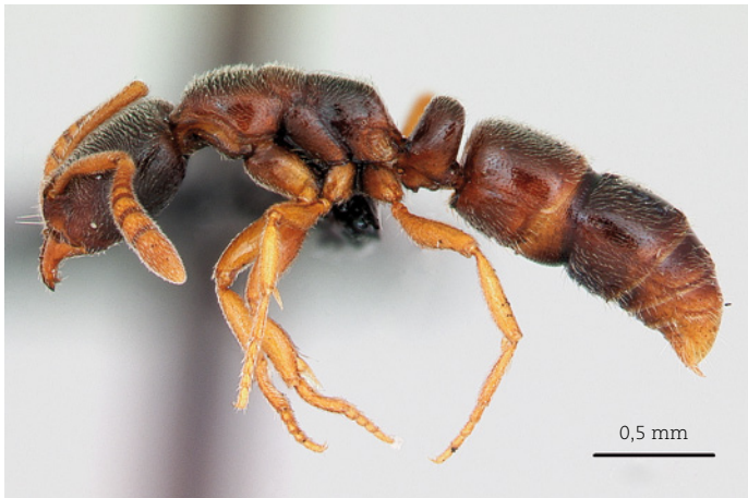
1. De zwarte staafmier Ponera coarctata . 1. Ponera coarctata .