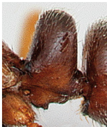
3. De petiolus van Ponera coarctata . 3. Petiolus of Ponera coarctata .