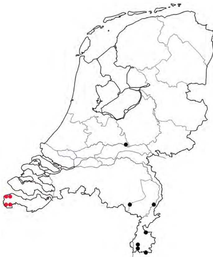
5. Vindplaatsen van Homalenotus quadridentatus in Nederland, inclusief onze nieuwe waarnemingen in Zeeuws-Vlaanderen (rood).