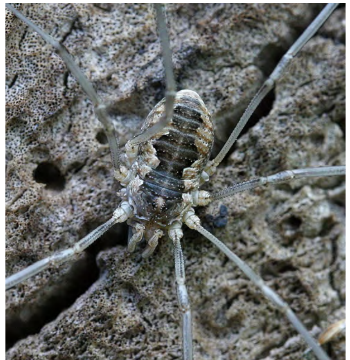
3. Phalangium opilio , links een mannetje en rechts een vrouwtje; de meest aangetroffen soort in de akkerranden. 3. Phalangium opilio , on the left a male and on the right a female; the most frequently caught species in the field margins.