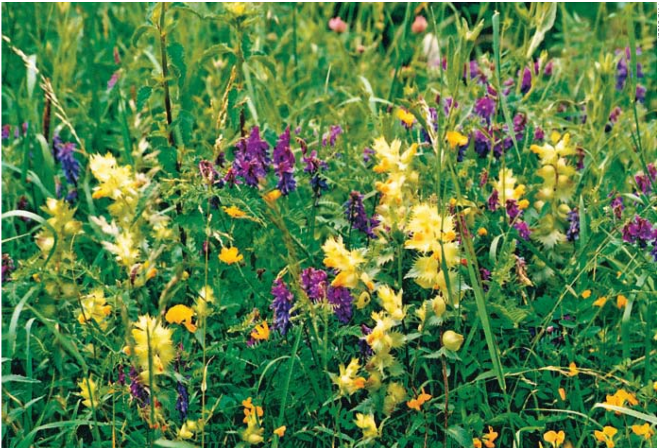
Kleurenpalet aan bloemen.

Een van de landschappelijk mooiste wandelingen kan men maken ten zuidwesten van Setcases in een gebied dat Catllar wordt genoemd. Men wandelt door beboste heuvels en idyllische weilanden omzoomd met struwe-