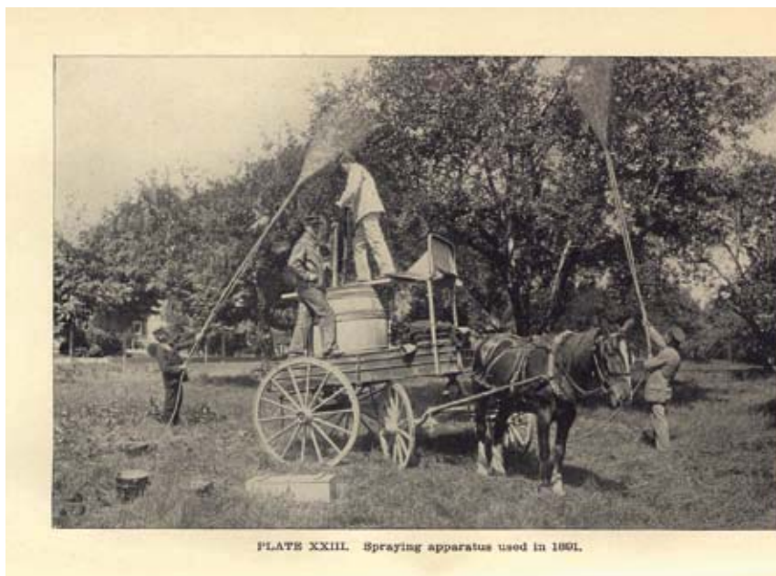
Figuur 2. Bespuitingen – levensgevaarlijk voor man en paard, en weinig effectief [p 137]. Veel later zijn natuurlijk ook DDT en andere chemische bestrijdingsmiddelen massaal gebruikt tegen de plakker.

Het lijkt geen twijfel dat Trouvelot zorgvuldig heeft gehandeld. Niettemin veroorzaakte hij een ramp van moeilijk te evenaren omvang. In onze streken is de plakker geen lieverdje in de bosbouw, maar als plaag is de soort in Europa niet te vergelijken met waartoe hij in Amerika in staat is. De les is dus dat het overbrengen van een soort naar een ander deel van de wereld met een vergelijkbaar klimaat een onvoorspelbaar risico van mogelijk enorme omvang in zich bergt. Daarom zou het een vast beleid moeten zijn van elke overheid dat