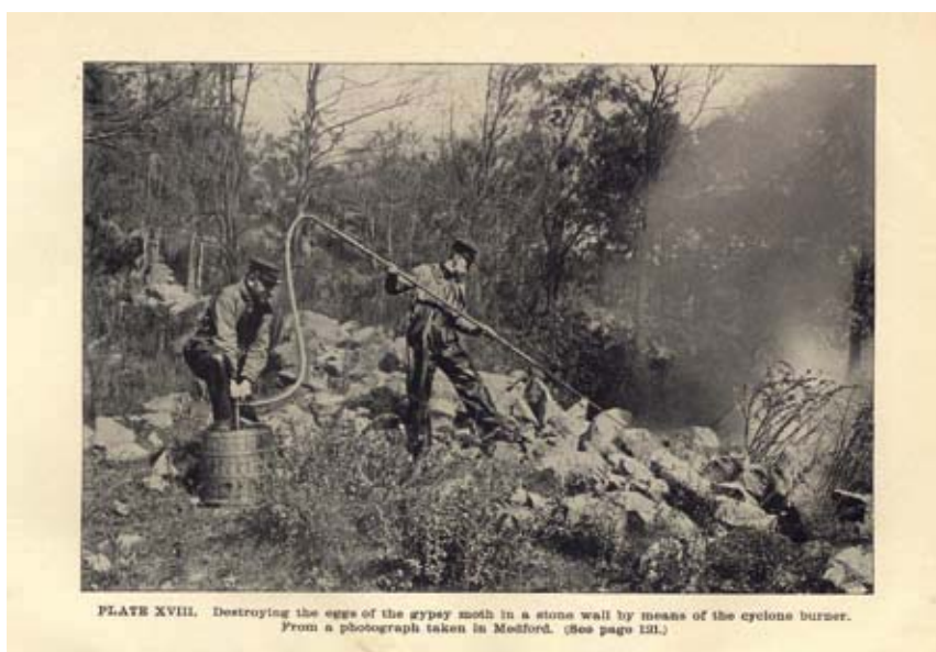
Figuur 3. De 'cyclone burner' een soort primitieve vlammenwerper werd ingezet om de eieren in muurspleten te vernietigen. Foto genomen in Medford [p 117]

Gerardi M.H. & J.K. Grimm (1979). The history, biology, damage, and control of the gypsy moth Porthetia dispar (L.). Fairleigh Dickinson UP, Rutherford. ●