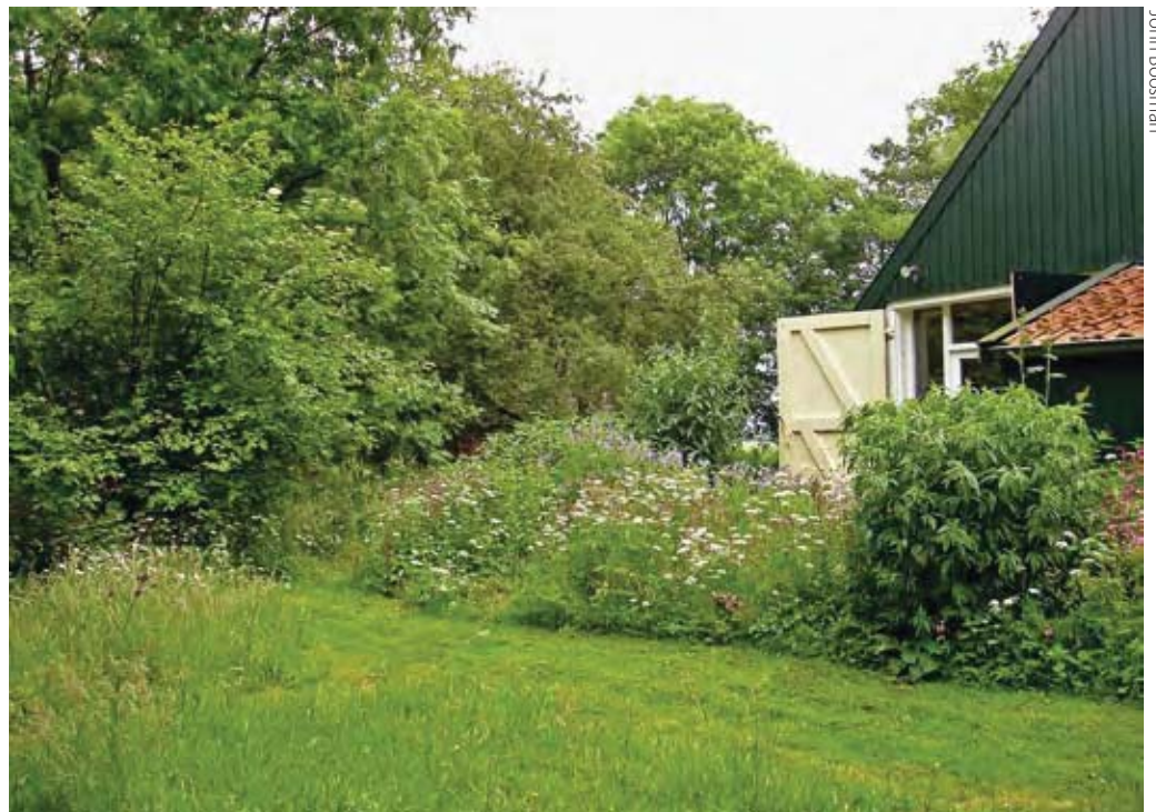
De tuin waarin het onderzoek heeft plaatsgevonden.