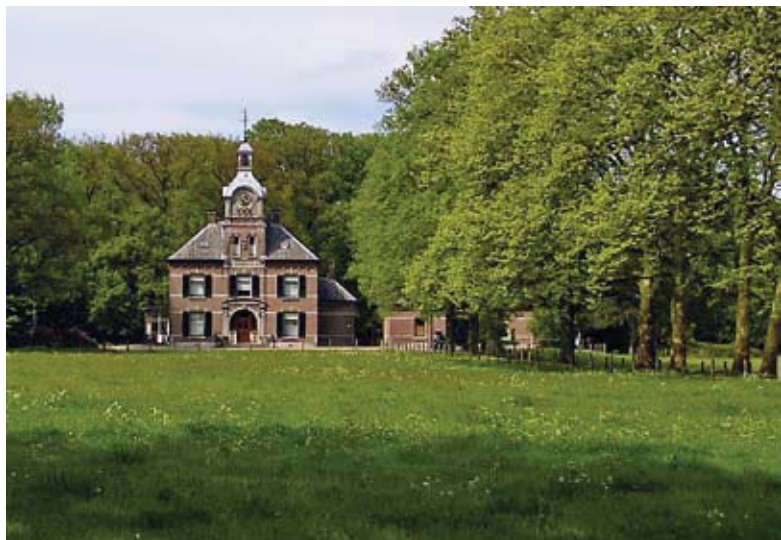
Het bos en de lanen rondom het landhuis worden instandgehouden.

Er zijn op verschillende plekken langs de route inhammen in de bosrand gemaakt om een gevarieerde bosrand te creëren. Bij de werkzaamheden is de wilde kamperfoelie (waardplant van de kleine ijsvogelvlinder) zoveel mogelijk gespaard. Daarnaast is een groot perceel met naaldbos, dat als belemmering voor de migratie van vlinders werd gezien, gekapt. De kapvlakte mag zich