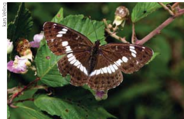
De kleine ijsvogelvlinder is gebaat bij natuurlijk verlopende bosranden waar veel nectar te vinden is.

Ongeveer 3 kilometer ten noordwesten van Brummen ligt een 184 hectare groot landgoed, Het Leusveld. Het landgoed, dat eigendom is van Natuurmonumenten, ligt op de overgang van de Veluwe naar het IJsseldal en is opgebouwd uit loofbos, naaldbos en graslanden. Het loofbos bestaat uit gemengd bos met zomereik, berk, beuk, zwarte els en populier. Verder zijn er nog een aantal percelen met grove den, fijnspar en lariks. Er is een aanzienlijke oppervlakte voormalig eikenhakhout, dat deels op rabatten is aangelegd. Deze rabatten, opgehoogde stukken grond tussen ontwateringsgreppels, waren nodig omdat door de hoge grondwaterstand de eiken het niet zouden overleven. Juist deze (voormalig) vochtige delen vormen het leefgebied van de kleine ijsvogelvlinder. De ondergroei is bijzonder gevarieerd met veel kamperfoelie, de waardplant van de vlinder. Graslanden, waarvan een deel getypeerd kan worden als bloemrijk hooiland, vormen circa een derde deel van het landgoed.