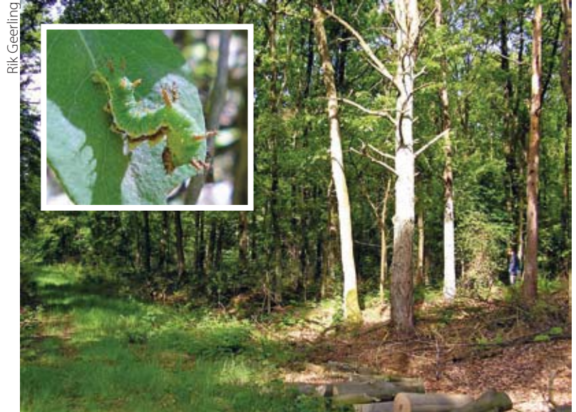
De voortplantingsbiotoop van de kleine ijsvogelvlinder. Inzet: De kleine ijsvogelvlinder heeft een opvallende rups die zich echter niet gemakkelijk laat vinden.

Het beheer op het Leusveld van de afgelopen decennia is over het algemeen gunstig geweest voor dagvlinders en zeker voor de kleine ijsvogelvlinder. Belangrijke maatregelen zijn pas in 2004 uitgevoerd en welke gevolgen die precies zullen hebben, moet nog blijken. De maatregelen zijn uitgevoerd conform de huidige inzichten over vlindervriendelijk bosbeheer en het is dan ook aanname-