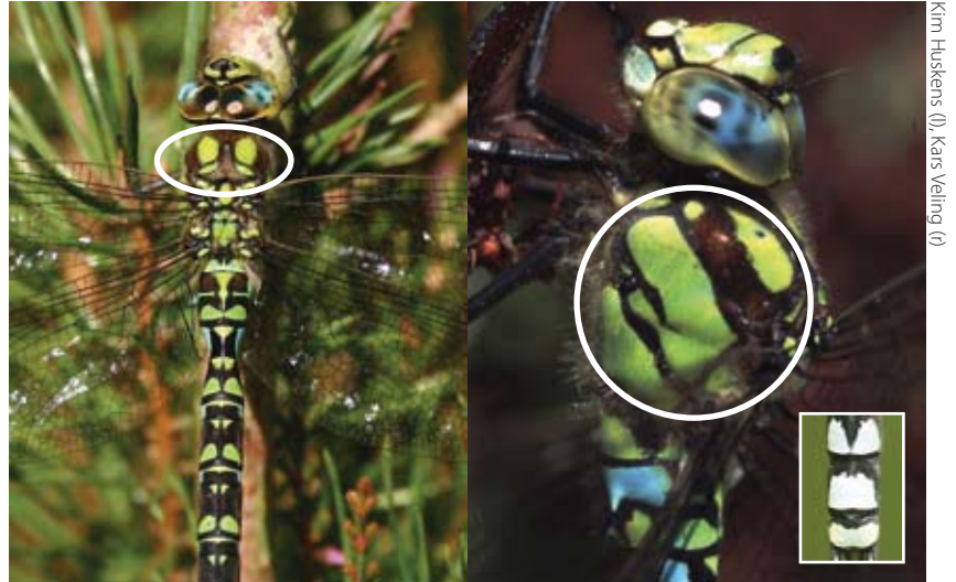
De blauwe glazenmaker heeft grote ovale schouderplekken; veel groen op de zijkant van het borststuk en een 'lantaartje' aan het achterlijf.

Blauwe glazenmakers zijn zeer algemeen bij voedselrijke plassen en tuinvijvers. Ze vliegen in een rustig tempo laag boven de grond, meestal in de schaduw. Ze zoeken hun omgeving minutieus af en komen daarbij vaak opvallend dicht in de buurt van mensen en bebouwing. Door dit gedrag komen blauwe glazenmakers nogal eens binnenhuis achter het vensterglas terecht, of ze worden gevangen door huiskatten.