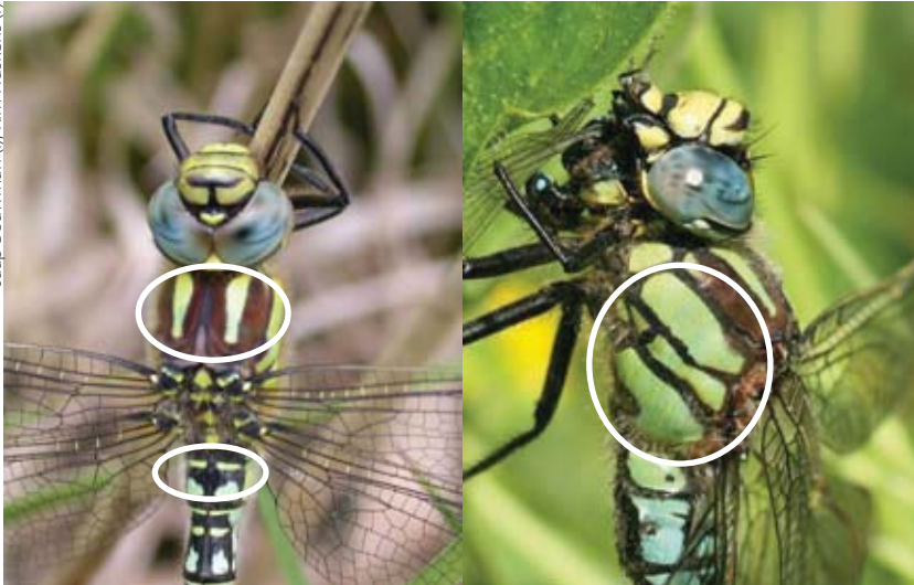
De glassnijder heeft goedontwikkelde schouderstrepen en geen geel spijkertje of lengtestreepje; veel groen op de zijkant van het borststuk. Let ook op de subtiele donzige beharing.