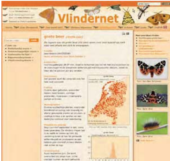
Soortpagina van de grote beer ( Arctia caja ).

op de Veldgids Dagvlinders (Wynhoff et al. 1999) en De dagvlinders van Nederland: verspreiding en bescherming (Bos et al. 2007). Maar er waren veel meer ideeën en daarvoor was het nodig om het bouwen van een nieuw Vlindernet over te laten aan een professionele website-bouwer: Argiope Webdesign (www.argiope.nl). Het jaar 2007 hebben we gebruikt om de website te laten bouwen en om Vlindernet te vullen met allerlei nieuwe informatie. Tijdens de Landelijke Vlinderdag op 8 maart 2008 werd het nieuwe Vlindernet gepresenteerd.