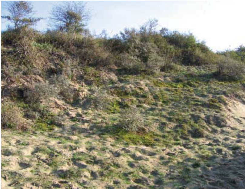
Figuur 3. Het duinviooltje groeit vooral op zonnige hellingen in open duingebieden, waar nog enige verstuing plaatsvindt.

de vrouwtjes van de kleine parelmoervlinder als ideale afzetplanten worden gebruikt, te beschermen tegen betreding en te sterke vertrapping door grazers. Dit kunnen we doen door de duinviooltjes omgeven door mos in gebieden die vlak bij de zeelijn liggen af te rasteren tijdens de wintermaanden. In meer landinwaarts gelegen duingebieden rasteren we dan weer duinviooltjes omringd door zand tijdelijk uit. Elke winter kunnen andere geschikte plekken afgerasterd worden, zodat verstuweling van deze zones wordt verhinderd. Buiten het winterseizoen is afrastering minder noodzakelijk omdat de grazers dan eerder grasrijkere gebieden in de duingebieden opzoeken en de zand- en mosrijke plekken eerder lijken te vermijden. Bijkomend onderzoek naar de effecten van begrazing zelf zou informatie kunnen opleveren over het directe (vertrapping) of indirecte (verstoring van mieren die instaan voor verbreiding van zaden) effect op het duinviooltje zelf.