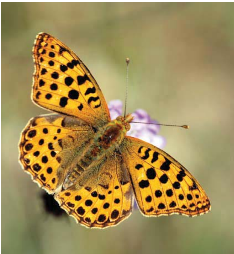
Figuur 1. De kleine parelmoervlinder onderscheidt zich door het stippenpatroon op de bovenkant gemakkelijk van andere parelmoervlinders.

Anderzijds creëert begrazing net kortgrazige plekken en open en gevarieerde vegetaties waar de kleine parel-