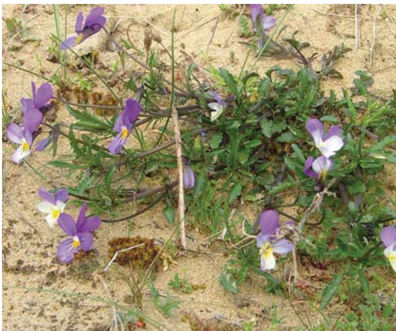
Figuur 2. De voornaamste waardplant van de kleine parelmoervlinder in de duinen is het duinviooltje.

In gebieden met kleine populaties van de kleine parelmoervlinder, lijkt het dan ook zinvol om er voor te zorgen dat (een deel van) de duinviooltjes die door