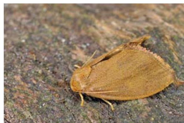
Vrouwetje van de kleine slakrups, mannetjes zijn donkerbruin.

Volgroeide rupsen worden maximaal 12 mm groot; de rupsen van wijfjes zijn groter dan die van mannetjes. De lichtgele tot groene kop en de 'echte' poten aan het borststuk zijn intrekbaar en daardoor meestal niet zichtbaar. De buik is wittig tot vleeskleurig lichtroze, de rug meestal groen. Op de rug bevindt zich een ruitvorm die zich uitstrekt van het anale segment tot aan de kop. Deze ruitvorm kan enorm variëren in vorm en kleurintensiteit: van licht- tot donkerbruin. Vaak is deze ruitvorm (zadelvlek) aan de buitenzijde met witgeel en of paarsrood afgezet.