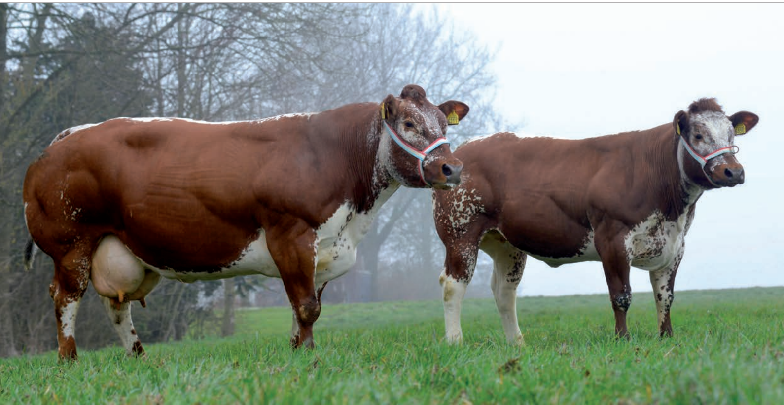
De excellente staffavoriet Coba 16 , goed voor een melkproductie van 5600 kilo melk, met haar Jacobardochter en showwinnares Coba 19

af naar slechts supermarktvlees. Bovendien moeten vleesveehouders en slagers de positieve kenmerken van de vleesveehouderij veel meer uitdragen. We gebruiken van alle dierhouderijen de minste antibiotica, veel dieren worden op stro gehouden in plaats van op roosters en het gros gaat naar buiten.'