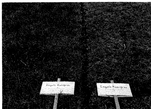
Veldjes met verschillen in vorstschade (voorjaar 1986).

Dit artikel is ontleend aan PR-rapport 113 „Vorstschade in grasland”, samengesteld door J.A. Keuning (NMI), P.J.M. Snijders (PR) en H. van Dijk (IKC)