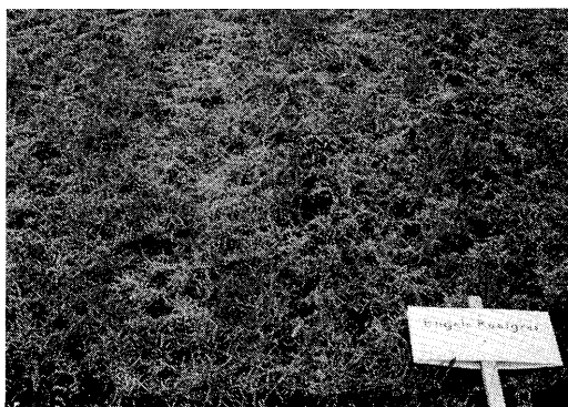
Vorstschade in veldje met Engels raaigras.

Over de samenhang tussen het uitrijden van dunne mest in najaar en winter en vorstschade in grasland is weinig onderzoek gedaan. Het wordt meestal wel als negatief beschouwd, mogelijk