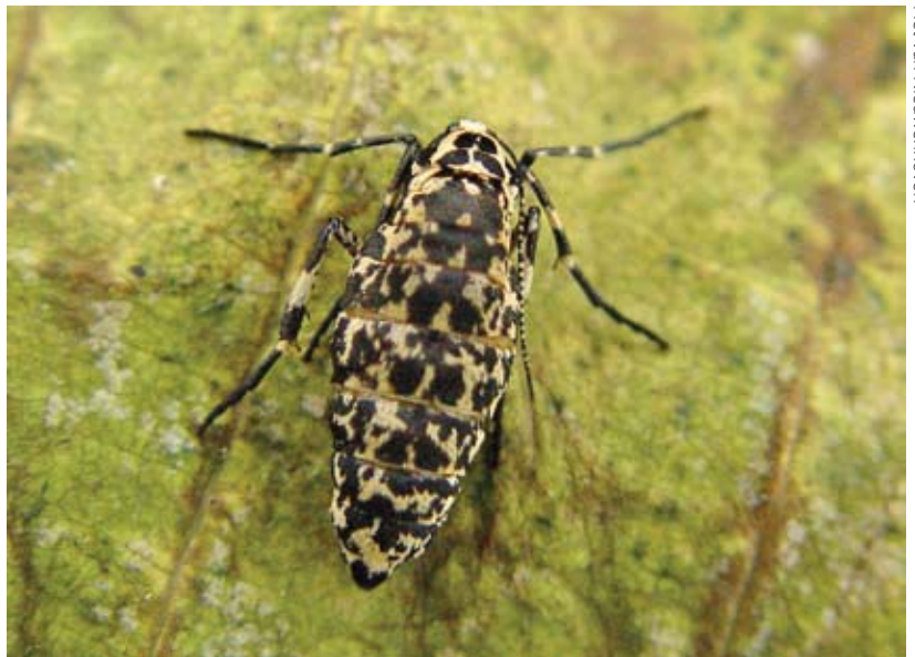
Piet van Nieuwenhoven

De communicatie tussen vlinders onderling verloopt grotendeels met behulp van chemische stoffen. Een voordeel van chemische communicatie is dat grotere afstanden kunnen worden overbrugd en dat deze vorm van communicatie ook in de schemer en in het donker plaats kan vinden. De meeste soorten nachtvlinders zijn uitsluitend actief bij schemer en donker en kunnen hun soortgenoten dus niet herkennen op basis van de UV-patronen op de vleugels. De mannetjes van nachtvlinders hebben juist hierom veervormige antennen in plaats van de draadvormige antennen die eindigen in een knopje