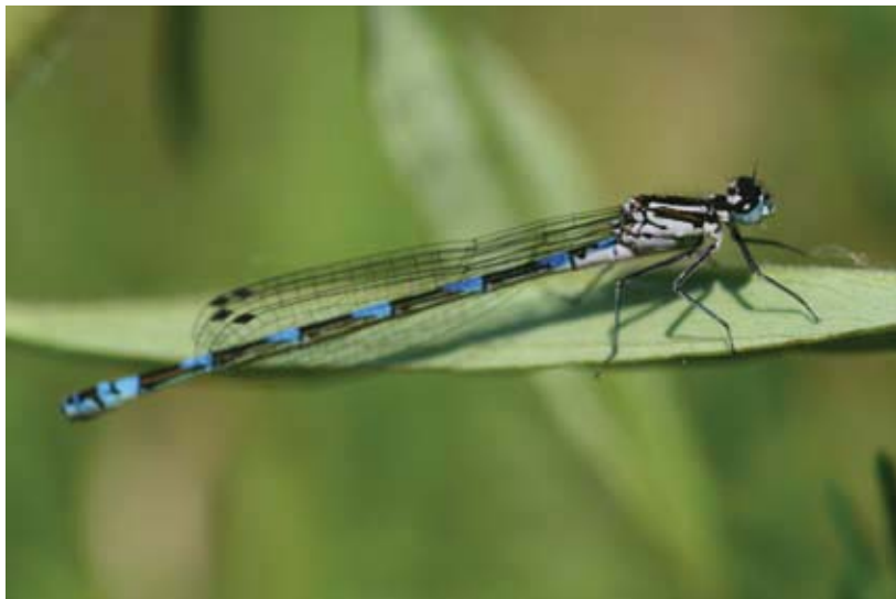
Camera niet loodrecht op de variabele waterjuffer (vrouwtje).

Instellingen digitale spiegelreflexcamera (Canon 30D): Sluittijd 1/500, Diafragma 4,5 en ISO 100. Macrolens: Sigma 150mm.