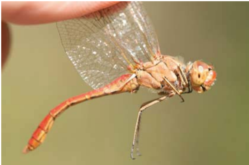
Zuidelijke heidelibel gevangen en vastgepakt aan vleugels. Instellingen (Canon 30D): Sluittijd 1/250, Diafragma 5,6 en ISO 250. Macrolens: Sigma 150mm.