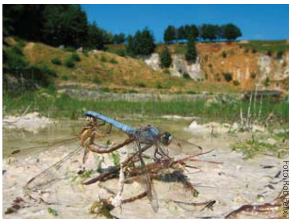
Zuidelijke oeverlibellen in hun omgeving.

Fotografeer, indien mogelijk, zowel de zijkant als de bovenkant van de libel. Soms is dit in één foto te combineren, soms zijn daar meer foto's voor nodig. Op die manier leg je de meeste kenmerken van de libel vast en is de soort achteraf het beste op naam te brengen.