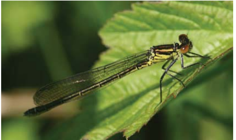
Schaduw op de grote roodoogjuffer (vrouwkje).

Let op de stand van de zon. De beste belichting krijg je als de zon schuin achter je staat. De libel wordt dan goed belicht (geen tegenlicht), terwijl je net niet in je eigen schaduw zit. Voordat je de libel benadert is het verstandig, indien mogelijk, al in de goede lijn tussen libel en zon te staan en dan pas de libel te benaderen. Als je dichtbij de libel staat en je kan door het zonlicht geen goede foto maken, loop dan niet op dezelfde afstand om de libel heen. Grote kans dat de libel door beweging meteen wegvliegt. Loop heel langzaam een aantal stap-