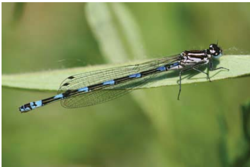
Camera loodrecht op de variabele waterjuffer (vrouwtje).

Instellingen digitale spiegelreflexcamera (Canon 30D): Sluittijd 1/500, Diafragma 4,5 en ISO 100. Macrolens: Sigma 150mm.