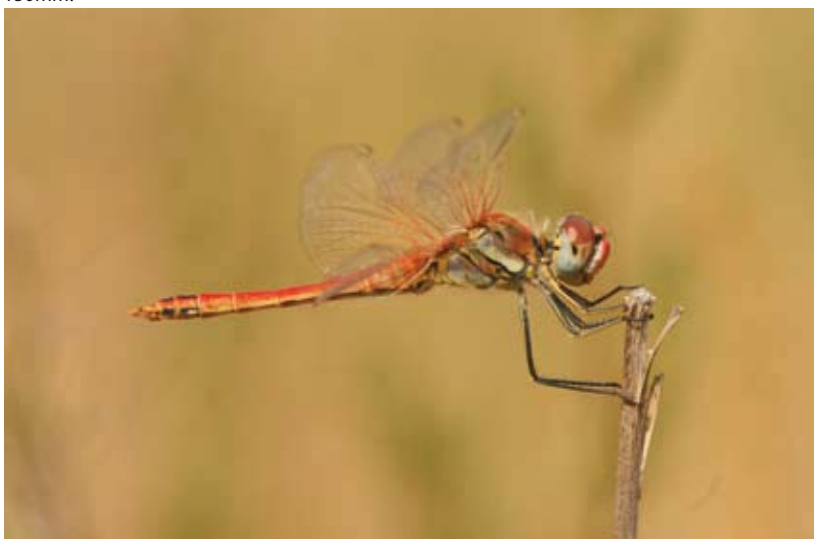
Deze zwervende heidelibel is niet gevangen en niet vastgepakt, waardoor de vleugels in natuurlijke houding staan. Instellingen (Canon 30D): Sluittijd 1/320, Diafragma 10,0 en ISO 400. Macrolens: Sigma 150mm.