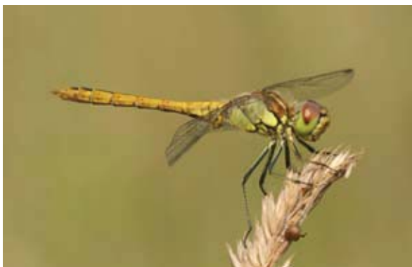
Steenrode heidelibbel (jong mannetje).

Het antwoord op deze vraag is afhankelijk van persoonlijke voorkeur en van het doel van de foto. De één houdt van sfeervolle natuurfoto's waarvan de libel slechts een onderdeel uitmaakt, terwijl het de ander puur om de libel gaat met alle kenmerken scherp in beeld. De tips die in dit artikel worden gegeven hebben betrekking op foto's van het laatste type: rustige, duidelijke foto's waarop de soort goed herkenbaar is.