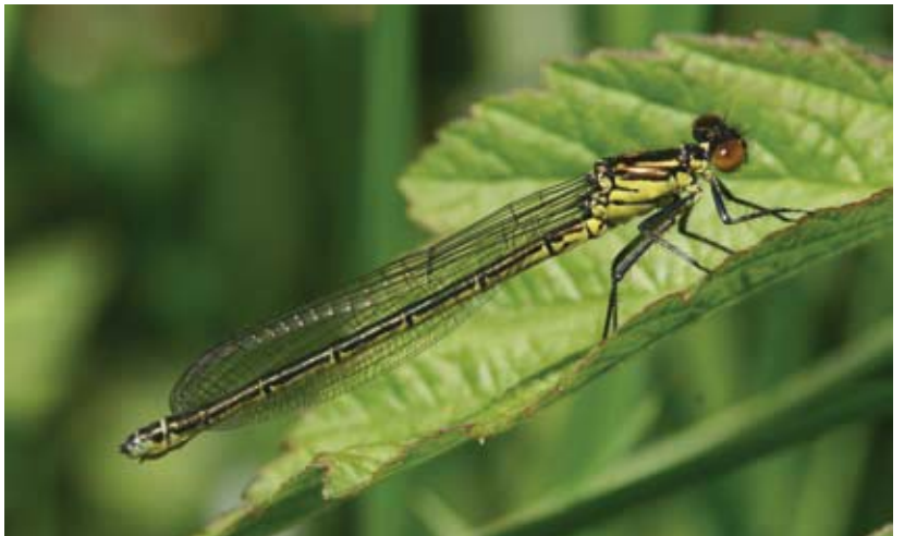
Geen schaduw op de grote roodoogjuffer (vrouwkje).

Instellingen digitale spiegelreflexcamera (Canon 30D): Sluittijd 1/250, Diafragma 10,0 en ISO 320. Macrolens: Sigma 150mm.