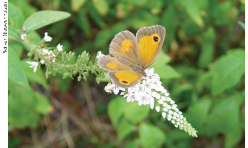
Het oranje zandoogje werd vaak gezien op de route.

Vanaf 1992 is na overleg met Waterschap Peel- en Maasvallei het langs het natuurreservaat en het bosperceel gelegen talud voor de eerste maaibeurt gespaard. In het najaar werd dit talud wel op de gewoonlijke manier gemaaid. In 1998 en vanaf najaar 2001 is het langs het natuurreservaat gelegen talud (secties 1-12) niet meer gemaaid. Dit na een mondeling verzoek van mij en in overleg met het Waterschap Peel- en Maasvallei. Vanaf najaar 2005 is het talud langs het bosperceel van landgoed het Kruis (secties 13-20) niet meer gemaaid. Mogelijk heeft het sparen van het talud langs het natuurreservaat en langs de bosrand van landgoed het Kruis een belangrijke bijdrage geleverd voor het herstel van een aantal soorten omdat meer rupsen nu beter kunnen overwinteren.