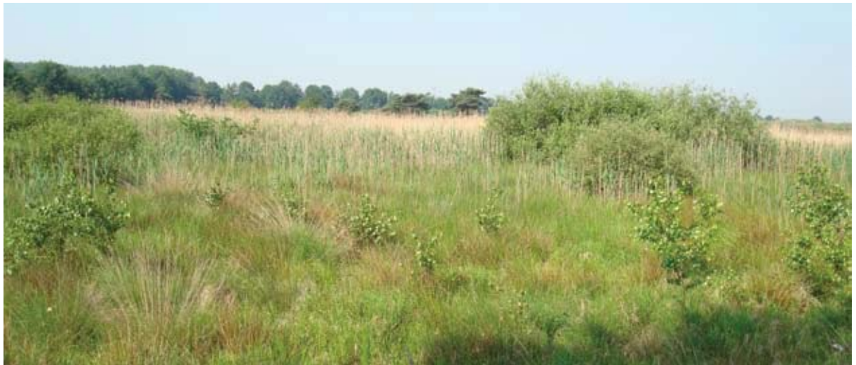
Piet van Nieuwenhuizen

Zicht op natuurgebied De Zoom vanaf de route.