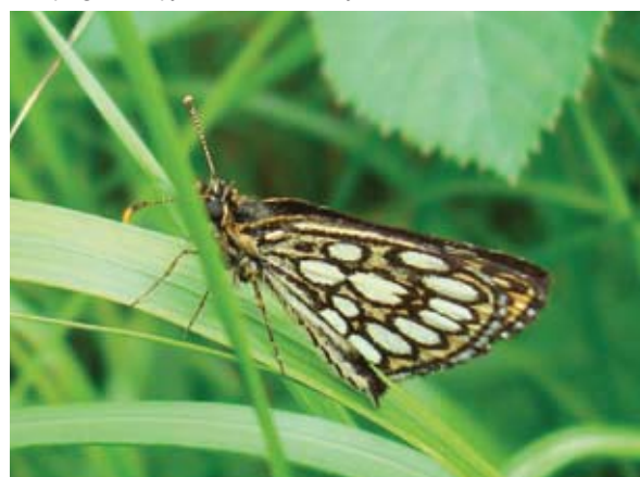
Piet van Nieuwenhuizen

Het spiegeldikkopje is ondertussen bijna verdwenen van de route.