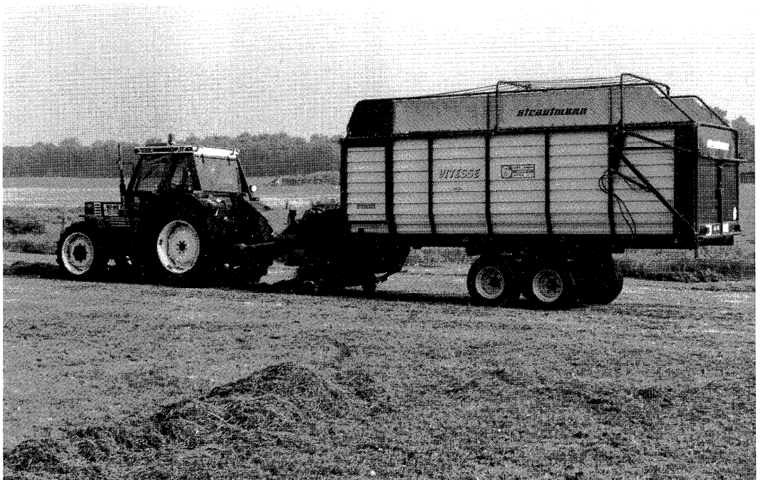
Goede voordroogkuil kan gemaakt worden in één dag als goed ingespeeld wordt op de weersverwachtingen.

land 's morgens om 6 uur aangeeft dat de neerslagkans voor de hele dag of voor de morgen en voor de middag maximaal 30 % is en dat de verwachte referentiegewasverdamping voor die dag minimaal 3 mm is (na 31 augustus 2,5 mm). Bij een dergelijke weersituatie bleek de doelstelling van minstens 35 % droge stof bij niet te zware sneden haalbaar. De dagen die aan genoemde criteria voldeden kwamen redelijk gespreid over het seizoen voor. In 1989 hoefde het maaien slechts één keer één dag te worden uitgesteld.