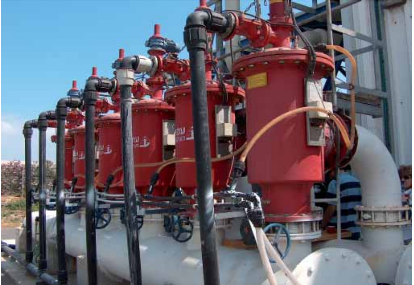
Gedeelte van de waterzuiveringsinstallatie van Maagan Michael.

nationale pijpleiding van noord naar zuid getransporteerd.