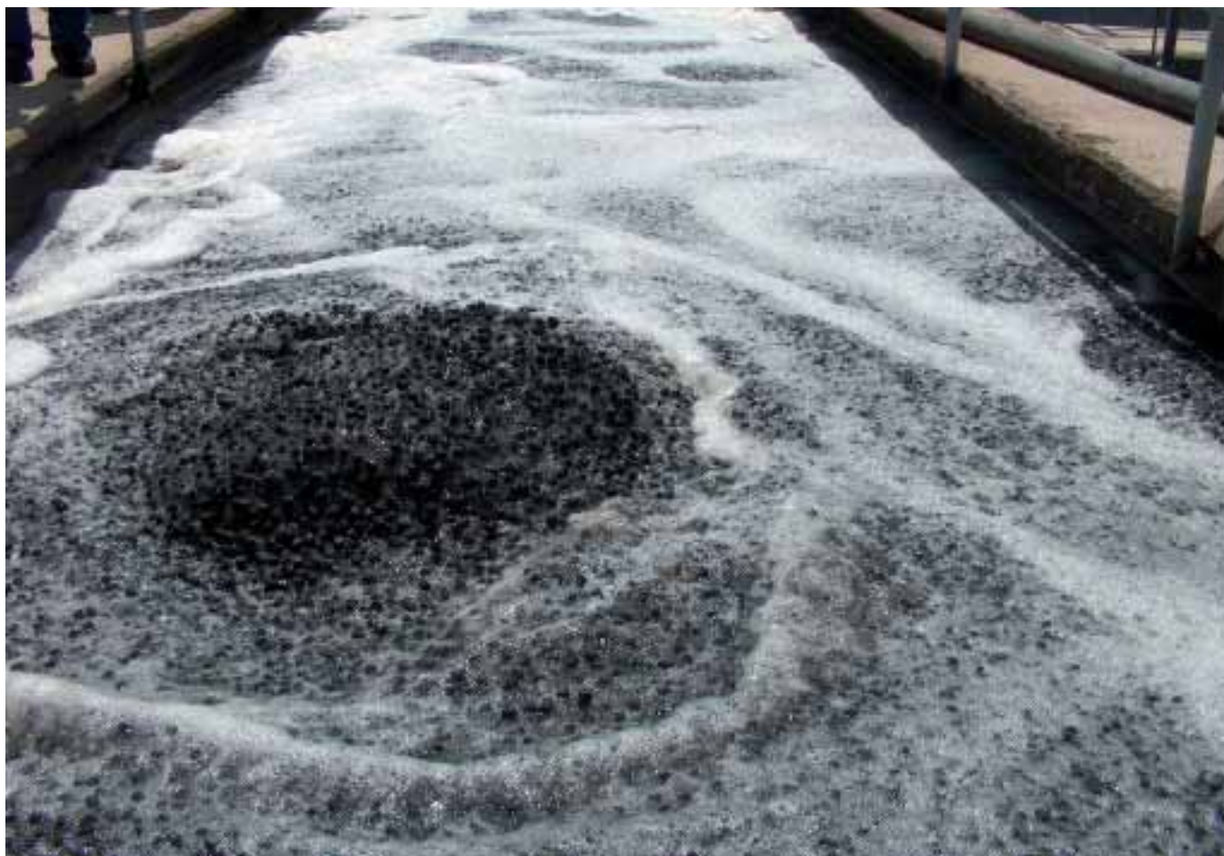
Plastic blokjes met bacteriën worden in het bassin rondgepompt en verwijderen in korte tijd de helft van de BOD.

het gelijkmatig in een bassin gepompt dat AGAR-modules bevat: plastic blokjes die bacteriën bevatten. Deze blokjes worden in het bassin rondgepompt en verwijderen in korte tijd de helft van de BOD. Daarna wordt het water verder gepompt naar een bassin met actiefslib. Vervolgens wordt het water gefilterd en geloosd op de rivier. De voordelen van deze techniek zijn het kleine benodigde volume, de snelle doorlooptijd en het feit dat de techniek is toe te voegen aan