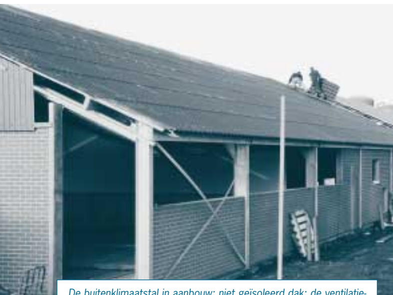
De buitenklimaatstal in aanbouw: niet geïsoleerd dak; de ventilatieopeningen zullen van een regelbaar gordijn worden voorzien