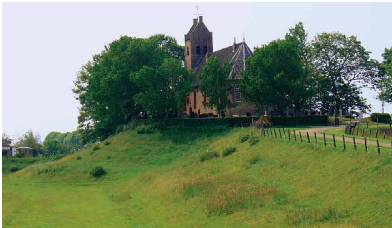
De terp van Hegebeintum.

en een deel van Drenthe) en dijkkring 43 (de Betuwe, Tieler- en Culemborgerwaarden). Voor deze dijkringen zullen de omstandigheden voor en tijdens overstromingen verschillen: in dijkkring 6 zal men te maken hebben met dijkdoorbraken vanuit zee ten gevolge van zwaar weer, terwijl in dijkkring 43 hoge rivierwaterstanden voor overstromingen zullen zorgen. Rivieroverstromingen zijn in de meeste gevallen langer van te voren te voorspellen en bieden dus meer gelegenheid voor grootschalige evacuatie. Toch kan het concept van zelfredzame cellen ook hier een extra waarborg zijn bij het in veiligheid brengen van mensen. In dit artikel laten we alleen de toepassing voor dijkkring 6 zien; voor de uitwerking voor dijkkring 43 verwijzen we naar het achtergrondrapport 5) .