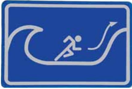
Verkeersbord voor de locatie van vluchtplaatsen.

staan. Het product van stroomsnelheid en waterdiepte is een indicator voor het verwoestende effect van water, waardoor ook vervoermiddelen en wegen kunnen wegspoelen. De stijgsnelheid ten slotte, de ontwikkeling van de waterdiepte over de tijd, beïnvloedt het aantal slachtoffers doordat het de mogelijkheid om een vluchtplaats te bereiken, kan belemmeren. Het gevaar dat uitgaat van een overstroming wordt geclassificeerd als groot als de stroomsnelheid groter is dan twee meter per seconde, het product van de stroomsnelheid en de waterdiepte (de kracht van het water) groter is dan 7 \text{ m}^2/\text{s} , het water sneller stijgt dan een halve meter per uur of de maximaal optredende waterdiepte meer dan twee meter bedraagt. Is er geen sprake van één van deze zaken, dan noemen we het gevaar klein.