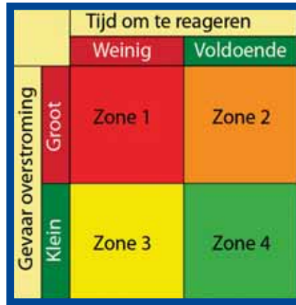
Afb. 1: Vier verschillende gevaarzones.

We onderscheiden twee typen vluchtplaatsen. Het eerste type is een verhoging waar mensen bij een daadwerkelijke overstroming naar toe kunnen vluchten. Er zijn geen faciliteiten en er is geen bescherming tegen weer en wind. Dit type vluchtplaats is geschikt voor gevallen waarin het gevaar van overstromen groot is en de tijd om een veilige plek te vinden klein (gevaarzone 1). Er zijn binnen een cel mogelijk meer van dit soort vluchtplaatsen. Dit type vluchtplaats is niet bedoeld om er lang te verblijven maar wel geschikt om bij groot gevaar heen te gaan. Vanaf een vluchtplaats van het eerste type kan men - zodra de omstandigheden dat toelaten - naar de vluchtplaats van het tweede type binnen