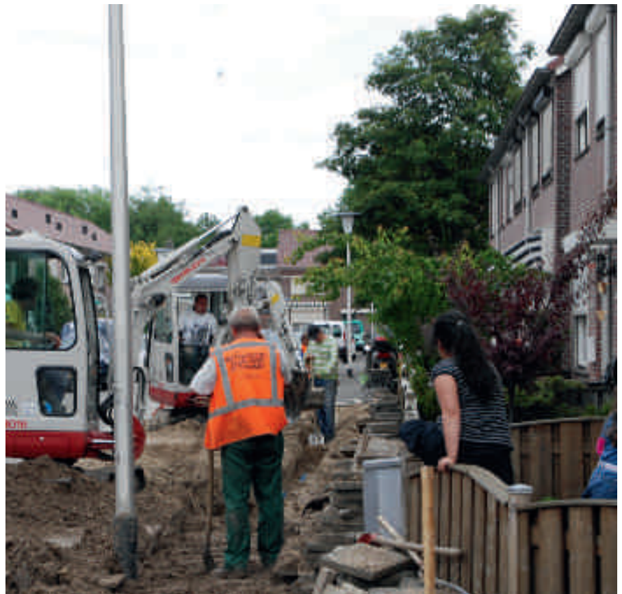
Vervangen van leidingen in Helmond.

Na het uit gebruik nemen van de watertoren in het centrum van Helmond is de transportstructuur eromheen deels blijven liggen. Een goed herontwerp vergt een inschatting van de toekomstige situatie in een verbruiksgebied.