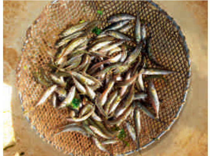
Links vissen uit de paaibiotop, rechts tiendoornige stekelbaarsjes uit de vlooienvijvers.

(58 tot 77 procent) van de aantallen vis. Het percentage van de aangetroffen soorten dat hier paait, varieert van jaar tot jaar van 71 (in 2008) tot 100 (in 2011). Brasem, paling en kleine modderkruiper zijn de enige hier niet-paaiende soorten.