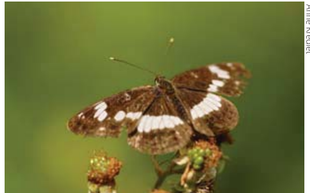
De kleine ijsvogelvinder.

"Enig ongeloof zaaide ik wel, tussen de klasgenoten. De doorsnee scholier is zeer vaardig met computer en games, blinkt uit op het hockey- en tennisveld, of kent alle typen auto's uit het blote hoofd. En tussen alle onderwerpen, van aerodynamica tot racisme, van tuinarchitectuur tot mode, stond ook 'De kleine ijsvogelvinder in het Leusveld'. Van Anne Krediet, die noch toetsenbord, noch tenniseracket, maar het vlindernetje hanteert. En die niet een Mercedes van een BMW, maar wel een trapeziumuil van een zwarte c-uil kan onderscheiden".