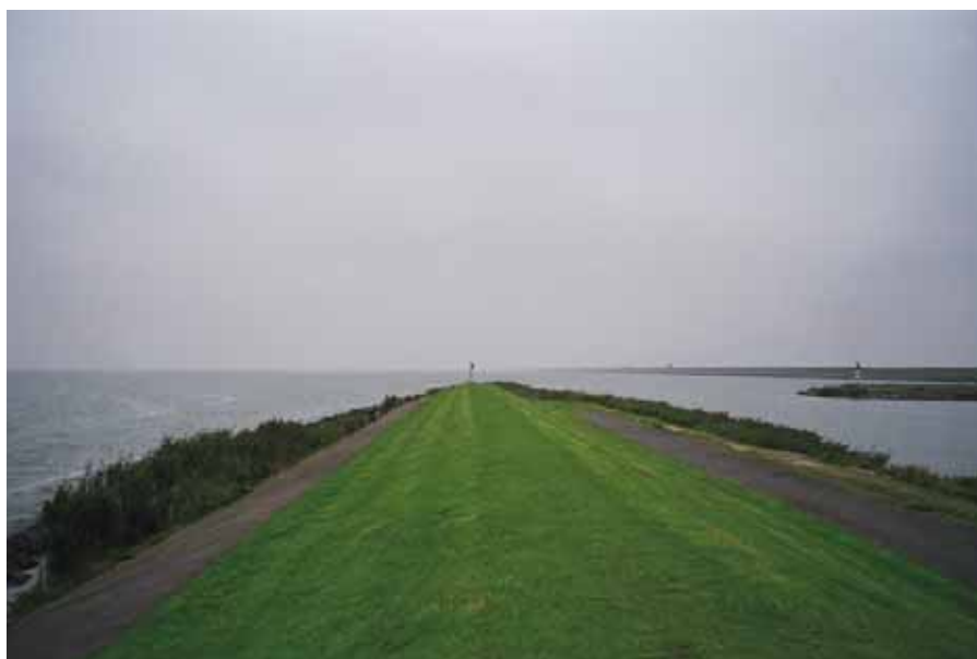
De Houtribdijk krijgt in het ontwerpplan een gemaakt.

Het ontwerp van het Nationaal Waterplan, dat op hoofdlijnen beschrijft welk beleid de komende jaren gevoerd moet worden om tot een veilig en duurzaam waterbeheer te komen, ligt ter inzage. Het ontwerp is op 22 december voor het eerst gepresenteerd, maar is nu gecompleteerd met de bijbehorende milieu-effectrapportage en passende beoordelingen. Belangstellenden kunnen hun reacties tot 22 juni toevoegen. Samen met een zojuist gepubliceerde evaluatie van het Planbureau van de Leefomgeving en de ingezonden reacties zal het kabinet in december het definitieve plan vaststellen.