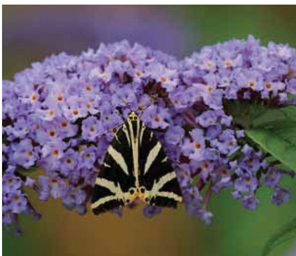
De spaanse vlag vertoont de laatste tien jaar een sterke toename.

De eindconclusie is dan ook: de trend van vlinders is de laatste tien jaar wat minder slecht dan daarvoor, en dat komt vooral doordat beheerders samen met De Vlinderstichting door hun harde werk de trend wisten om te buigen. Alle redenen om daarmee door te gaan, want goed beheer helpt echt.