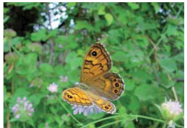
Het aantal argusvlinders was in het begin van de jaren negentig vijftientig keer zo groot als nu.

Dan zijn er vlinders die in de jaren negentig min of meer stabiel waren of vooruitgingen, maar de laatste tien jaar achteruitgaan (5 soorten). Hiertoe horen