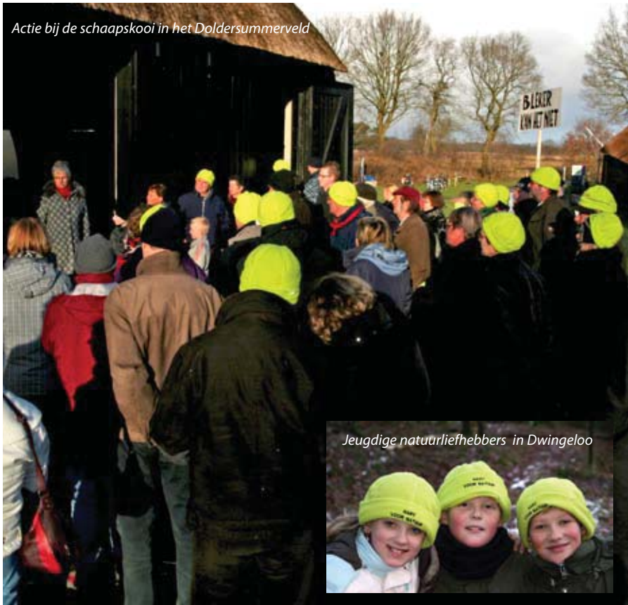
Jeugdige natuurliefhebbers in Dwingeloo