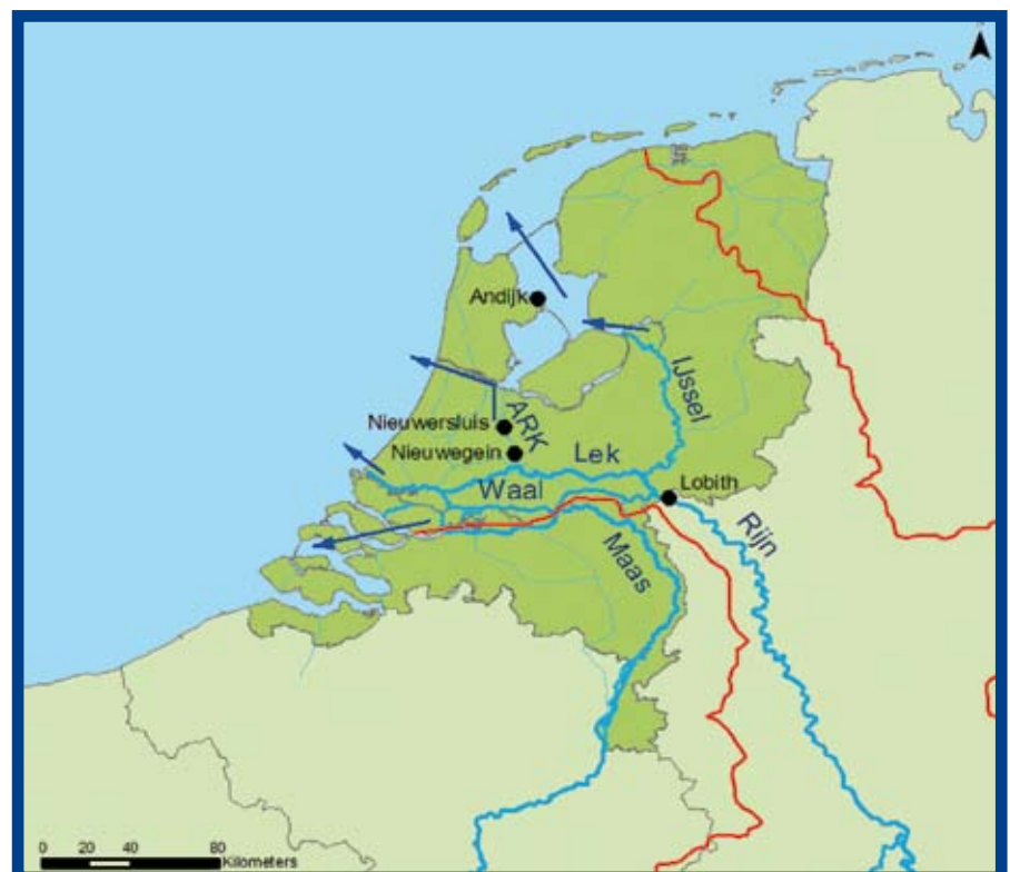
Afb. 1: Monsternamepunten langs de Rijn. Rode lijnen geven het stroomgebied weer. ARK = Amsterdam-Rijnkanaal.

Verskillende factoren bepalen de concentraties geneesmiddelen in het oppervlaktewater. De belangrijkste zijn de consumptie van een geneesmiddel in een bepaalde regio, de afbraak (metabolisme) van het geneesmiddel in het lichaam van de patiënt en uitscheiding (excretie) in urine en feces, de verwijdering van het geneesmiddel door de rioolwaterzuiveringsinstallatie (rwzi), het volume (waterdebiet) van het waterlichaam en de afbraak en sorptie in het milieu 1) . In deze studie is een evaluatie uitgevoerd van een zeer uitgebreide set meetgegevens