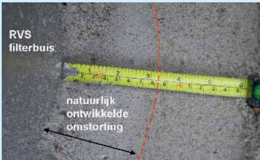
Een natuurlijk ontwikkelde omstorting rondom een RVS-wikkeldraadfilter.

name PVC-filters met radiale openingen (loodrecht op de lengterichting) blijken voldoende bestand tegen jetkrachten.