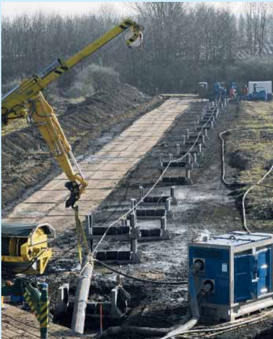
Aanleg van de verticale proefput op het terrein van waterproductiebedrijf Macharen (Brabant Water).

Tot op heden was horizontaal gestuurd boren voor het maken van putten in de praktijk niet succesvol. Omdat de theorie