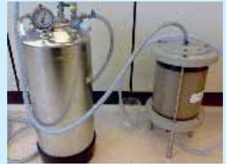
Kolomproeven naar het gedrag van boorspoelingen.

anders uitwees, is in 2006 een haalbaarheidsstudie uitgevoerd. Daaruit bleek dat zowel technisch als financieel de techniek van horizontaal gestuurd boren geschikt is voor het aanleggen van horizontale putten, mits de bestaande knelpunten op te lossen waren 1) . Daarvoor waren vooral ontwikkelingen nodig met betrekking tot filtermateriaal, boorspoeling en het prepareren van de boorgatwand rond het filtertraject. Naar aanleiding van dit haalbaarheidsonderzoek verrichtte een consortium uitgebreid laboratorium- en veldonderzoek om tot een duurzame en kostenefficiënte toepassing van een horizontale put te komen. Het consortium bestond uit KWR, Visser & Smit Hanab (uitvoering boring), IF Technology (adviesbureau voor duurzame bodemenergie), Brabant Water, Vitens en Waternet (waterleidingbedrijven en waterbeheerders) en Wavin (producent en leverancier PVC-materialen).