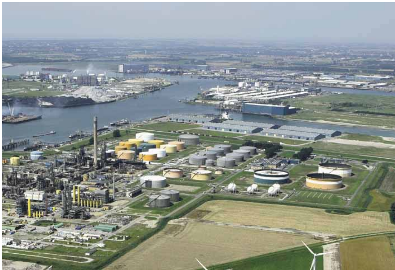
De haven van Vlissingen-Oost met de awzi Sloe rechts op de voorgrond.