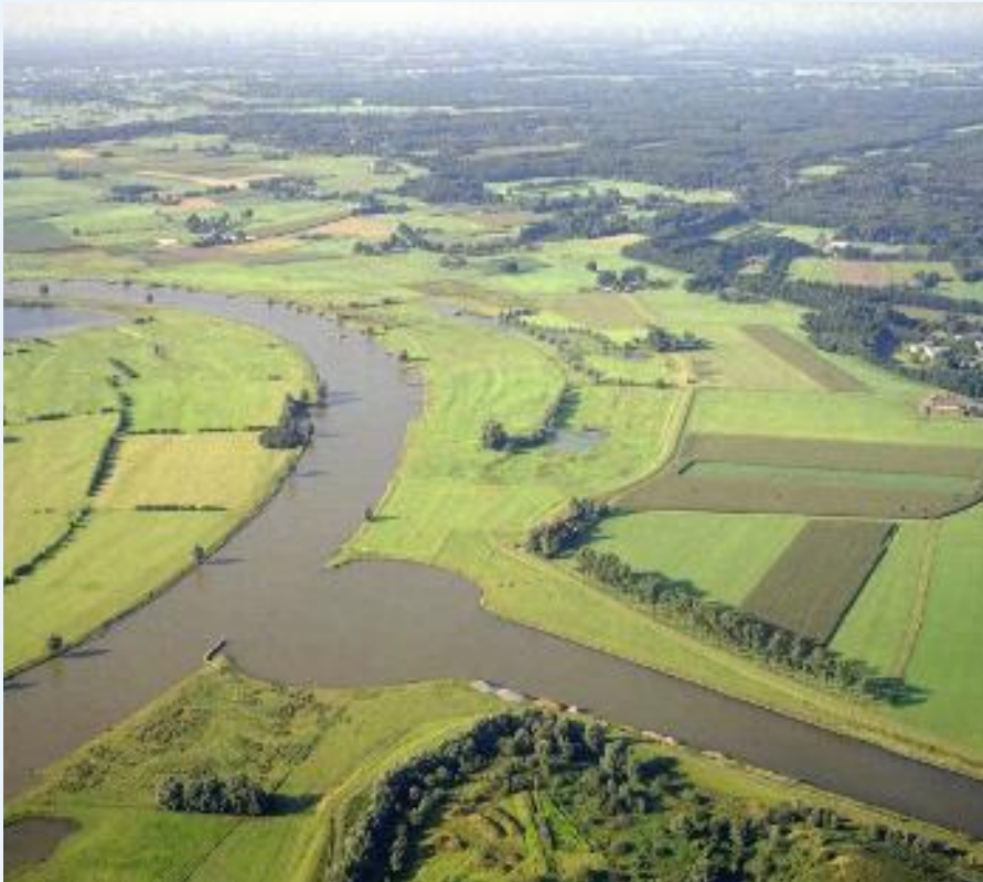
Monding Twenthekanaal in de IJssel.

voldoende water beschikbaar om alle watergebruikers optimaal van water te voorzien. De aanvoercapaciteit kan verder nog worden beperkt bij zeer lage afvoeren van de IJssel, waarbij door de toenemende opvoerhoogte de capaciteit van gemaal Eefde afneemt. In dergelijke situaties dient voor de waterbeheerders duidelijk te zijn aan welke categorieën watergebruikers nog wel en aan welke geen water meer wordt geleverd. Hiertoe wordt in het waterakkoord een verdringingsreeks opgenomen. Deze geeft de volgorde aan waarin de categorieën watergebruikers van water worden voorzien. Algemeen principe is dat de watergebruikers waarbij de economische schade door een watertekort het hoogst is, zo lang mogelijk van water worden voorzien.