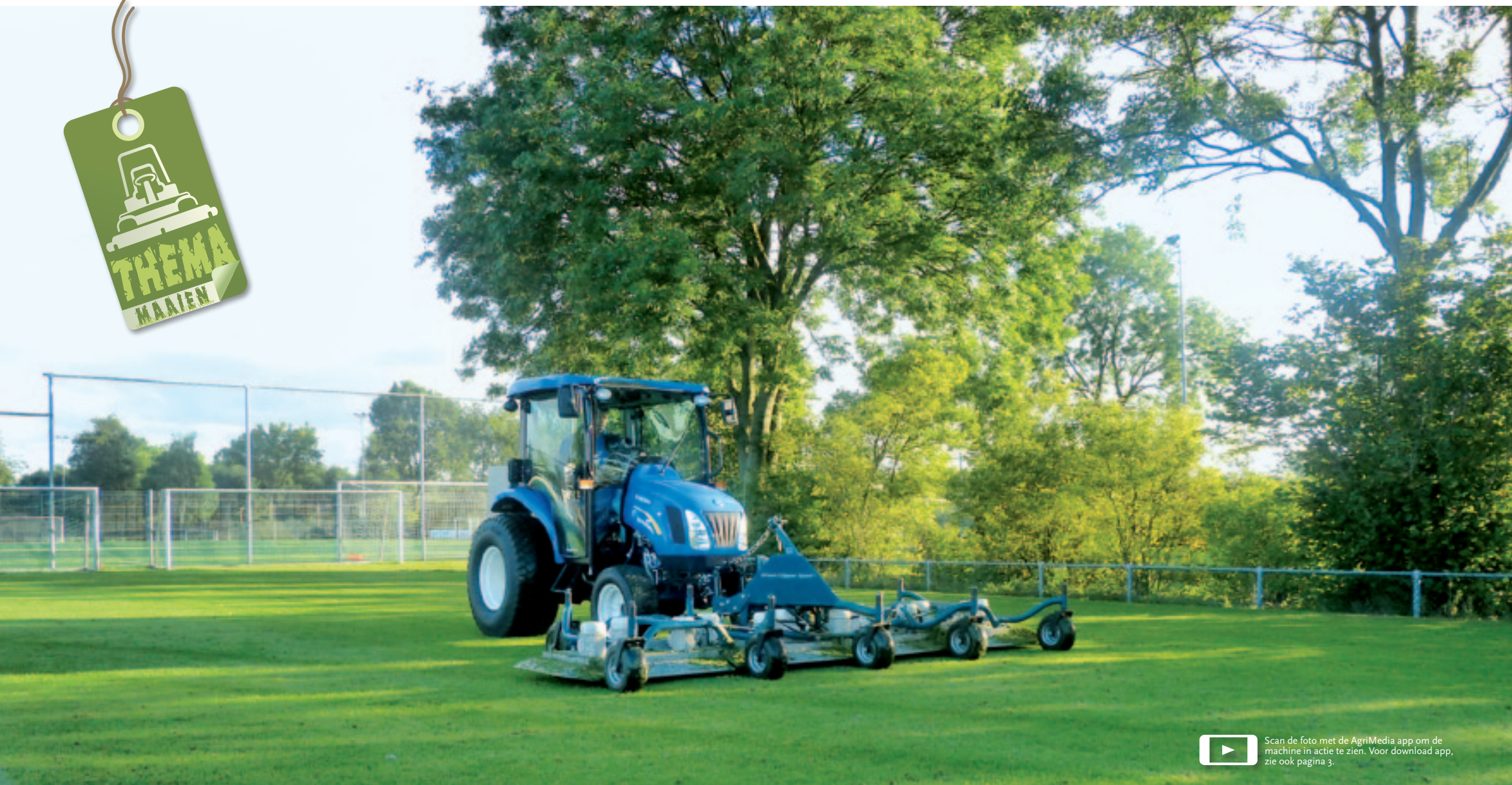
Scan de foto met de AgriMedia app om de machine in actie te zien. Voor download app, zie ook pagina 3.