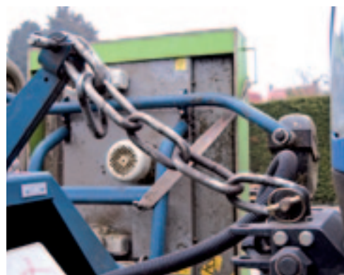
■ Een ketting in plaats van topstang zorgt ervoor dat de maaier contouren kan volgen.