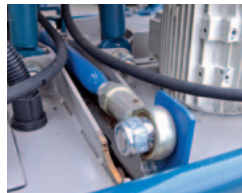
■ Den Hollander monteerde een stang met kogels tussen de middelste maaidekken.