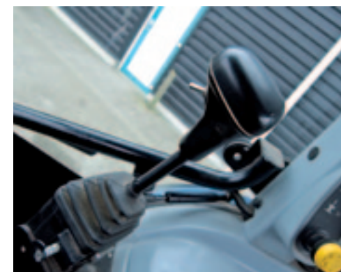
■ Op de kruishendel van Den Hollanders trekker zit een tuimelschakelaar.