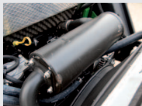
De Yanmar voldoet aan de Stage 3a-emissie-eis. Kleine motoren hoeven nog niet aan de Stage 3b-emissie-eis te voldoen.