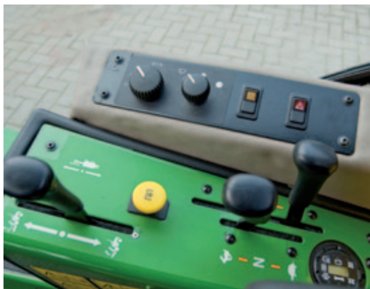
Alles wat je nodig hebt om te kunnen maaien, alsook bediening voor verlichting en ruitenwisser, zit binnen handbereik. De 1585 kenmerkt zich ook door de mechanische Hi-Low.

dat maakt de ruiten goedkoper. De losse voorruit van deze cabine kost iets meer dan 500 euro. Voorheen moesten John Deere-dealers de cabine apart bestellen bij de Oostenrijkse cabinefabrikant Walter Mauser. Opbouwen was vervolgens een intensieve klus.