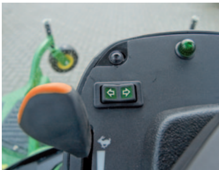
De chauffeur kan de stuurkolom naar zich toehalen. Op de stuurkolom zelf zit niet meer dan het stuur, de tuimelschakelaar voor de richting-aanwijzers en het handgas.