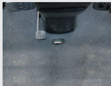
Door het 'lipje' naar voren te drukken, kun je met je rechervoet de parkeerrem activeren. Links ervan zit het differentieelslot.