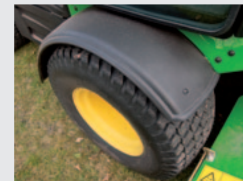
Door de voorwielen om te draaien, komt de maaier op breder spoor. Deze spatborden zijn dan wel wenselijk.