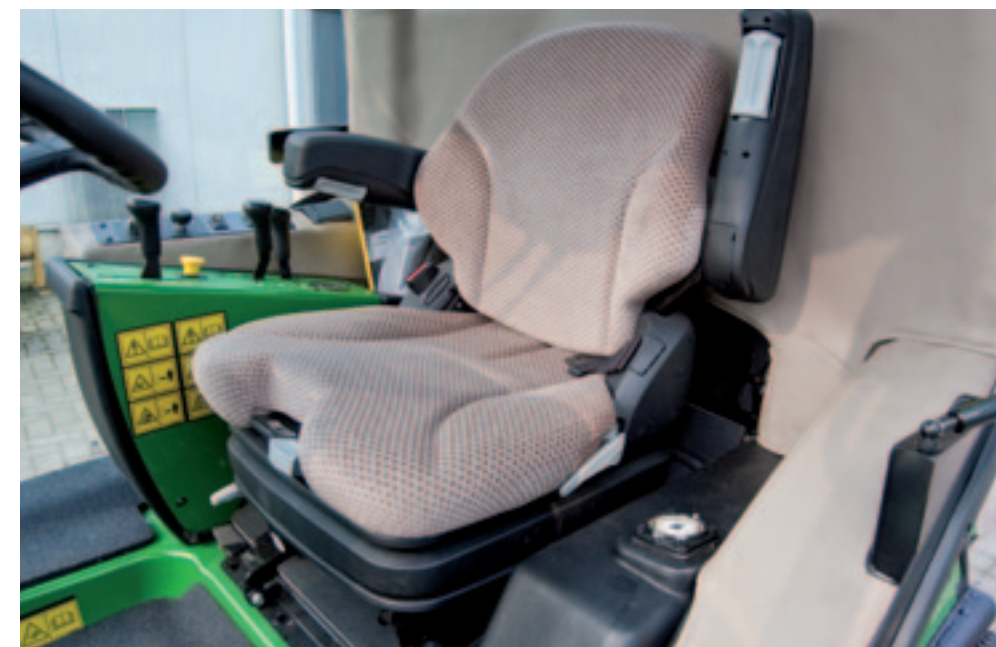
De cabine van de 1585 waarmee Tuin en Park Techniek reed, is voorzien van de optionele luchtgeveerde stoel. De kleur van de stoel en de cabinebekleding geven de cabine de John Deere-look. Voor wie de cabines van grotere John Deere-machines kent, voelt het een beetje als thuis komen.

Onderaan de stuurkolom zitten standaard twee werkklampen. Of het cabineglas het lichtbeeld niet negatief beïnvloedt, is de vraag. Deze stuurkolom kennen we al van de oude serie frontmaaiers. Tot slot monteert GroeNoord spiegels aan de maaier, die afkomstig zijn van de 4R-compacttrekker-serie van John Deere. De cabine op een maaier oogt vaak als een lomp groot hok. Maar bij de 1500-serie van John Deere lijkt het lijnenspel doordacht. Toch is de cabine niet specifiek voor de maaier ontwikkeld – John Deere monteert dezelfde cabine ook op 3720-compacttrekker, de voorganger van de 3R. In de cabine voelt het als thuis komen als je de cabines van grotere John Deere-machines gewend bent. Het is vooral de kleur van de