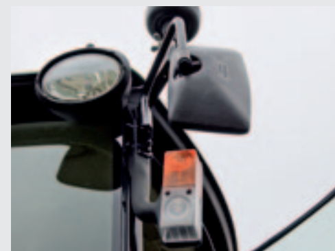
GroeNoord monteert een eigen verlichtingset. De stadslichten en richtingaanwijzers komen op de A-stijlen.