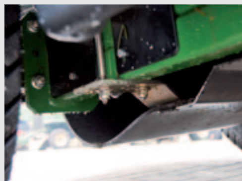
Een stalen plaat en een rubbermat onder de maaier, moeten het geluidsniveau in de cabine verlagen.