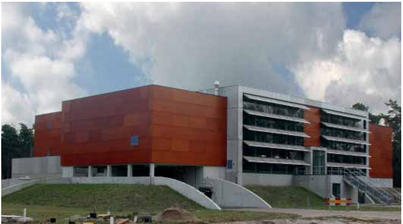
Waterproductiebedrijf Nuland.