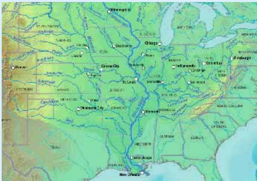
Afb. 1: Het stroomgebied van de Mississippi.

Bij de Mississippi staat een hoge rivierafvoer altijd in het perspectief van het hoogwater