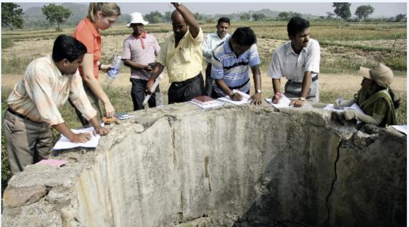
Een grote open put vormt vaak de watervoorziening in een dorp.

Al vanaf de eerste kennismaking in India werd duidelijk dat duurzame drinkwatervoorziening in India in alle aspecten verschilt van de ervaringen in Nederland. De staat Orissa met een oppervlak van 155.842 km 2 , circa vier maal zo groot als Nederland, grenst aan de Baai van Bengalen en kenmerkt zich door een oppervlak van hard gesteente (72%) en pakketten rivier- en kustsedimenten (28%). De precieze verbreiding van