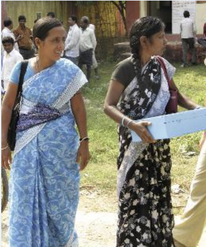
De hydrologen in Dunguruguda.