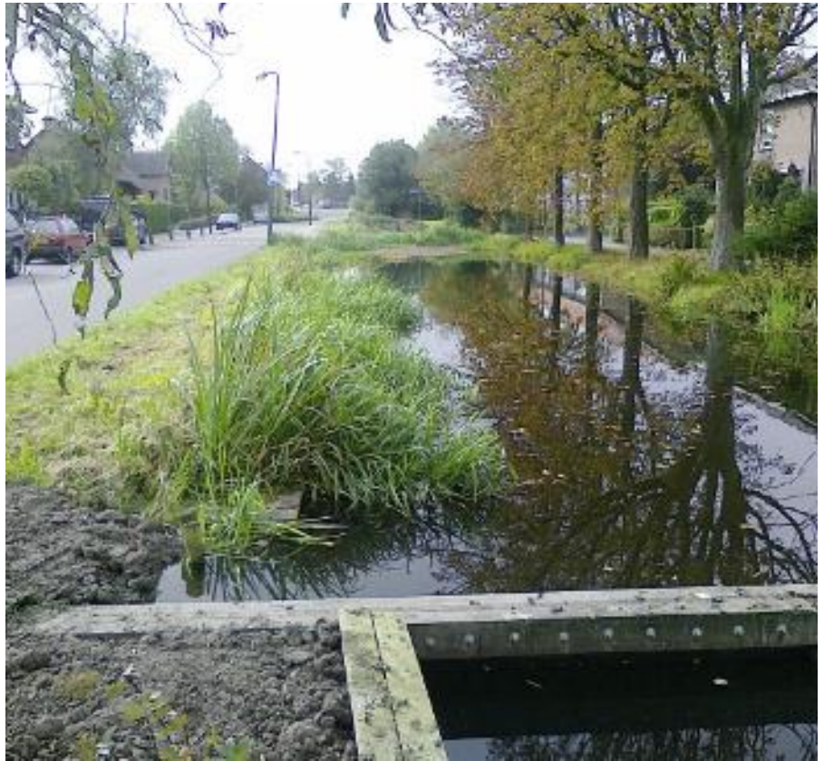
Geringe drooglegging in Kockengen.

Met het isotopenonderzoek is een inschatting gemaakt van de samenstelling van het afvalwater. In welke mate bestaat het monster uit drinkwater (oorspronkelijke bron rioolwater) en in welke mate uit oppervlakte- en grondwater (bronnen rioolvreemd water)?