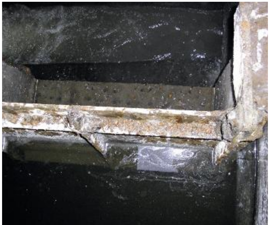
Overstort met lekkende keerklep in Utrecht.

beheerders van de afvalwaterketen speelt het drinkwaterbedrijf een belangrijke rol, met name vanwege het aanleveren van de verbruiks- en aanvoergegevens van het drinkwater. Helaas zijn deze gegevens vaak