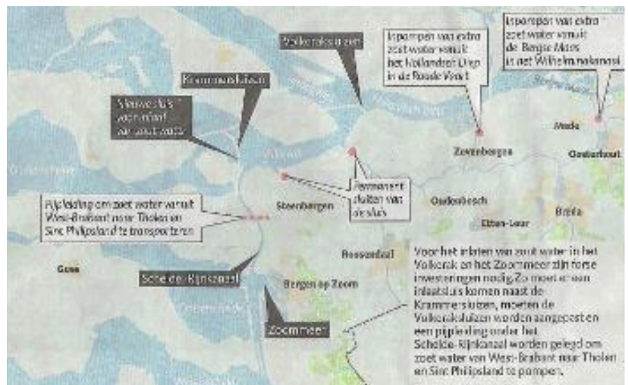
Aanpassingen als gevolg van de verziltning Volkerak-Zoommeer in kaart (bron: Brabants Nieuwsblad / De Stem).