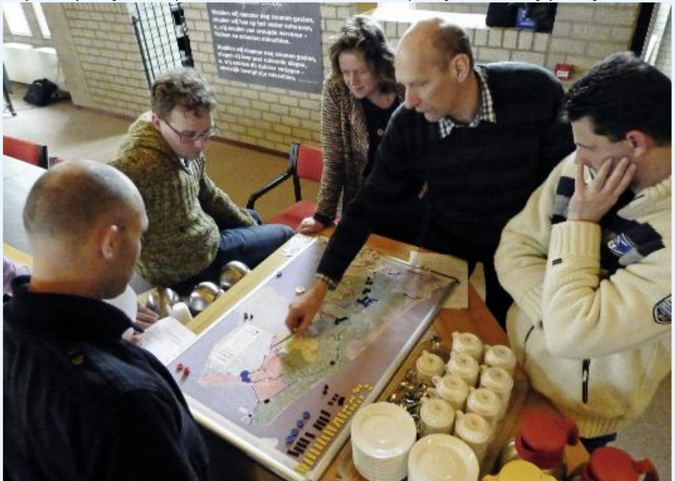
Een bijeenkomst bij het Hoogheemraadschap Hollands Noorderkwartier waar vanuit verschillende disciplines nagedacht wordt over mogelijke maatregelen.

Wanneer uit de toetsing bekend is welke boezemkades falen, is het zaak om een divers pakket van mogelijke maatregelen op te stellen. De inbreng vanuit diverse disciplines is hiervoor onontbeerlijk. Binnen Hollands Noorderkwartier hebben gebiedsexperts 13 mogelijke maatregelenpakketten bedacht. Zij konden het effect van de maatregelen op de uitkomst van de toetsing direct opzoeken in het informatiesysteem Lizard.