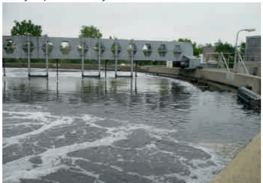
Beluchtingstank op een rioolwaterzuiveringsinstallatie.

In influent en actief slib op de onderzochte rwzi's is DNA van C. burnetii in lage concentraties aangetroffen. In eerdere studies tijdens de Q-koortsuitbraak werd C. burnetii DNA aangetoond in vaginaalwaps, feces en melk van geiten en schapen op besmette