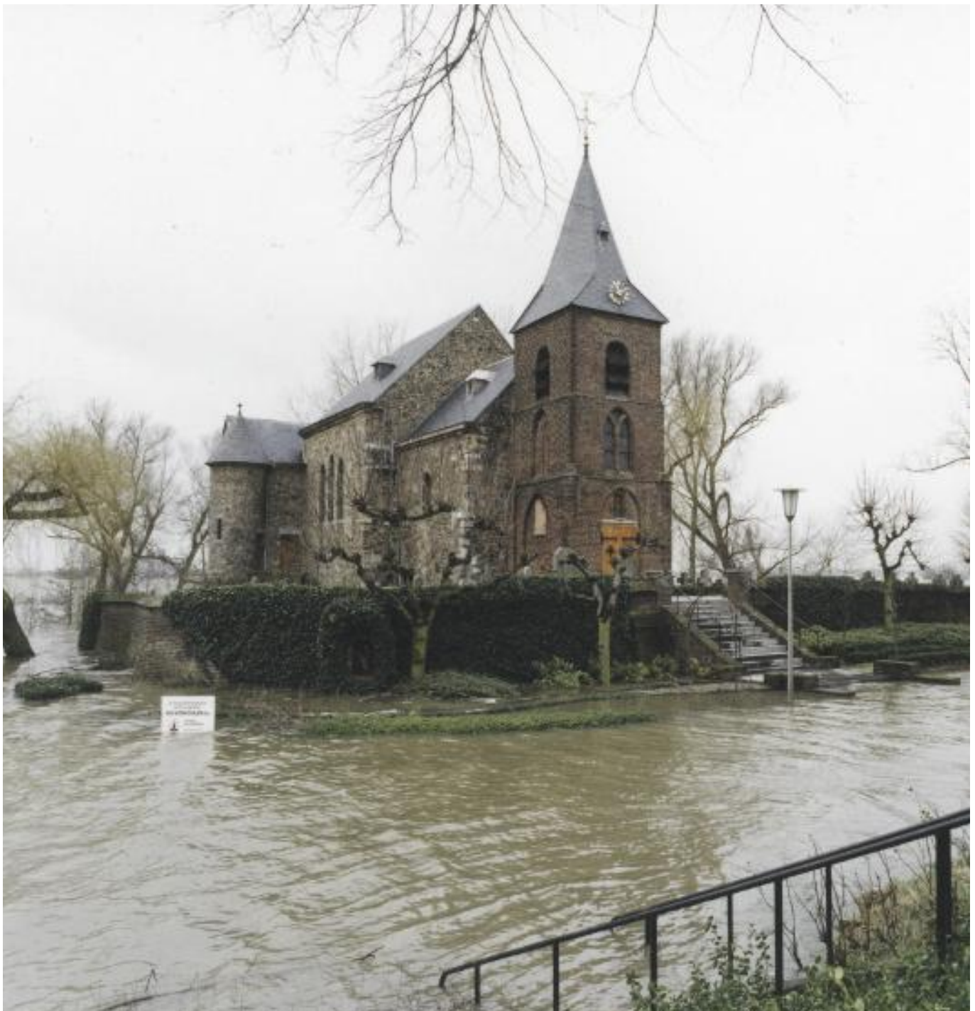
Kerk bij Asselt tijdens extreem hoogwater in 1995.